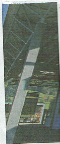
Jahr 2019 soll das lin